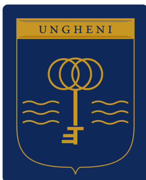
NU — color pe fundal navy — câmpul scutului se topește.