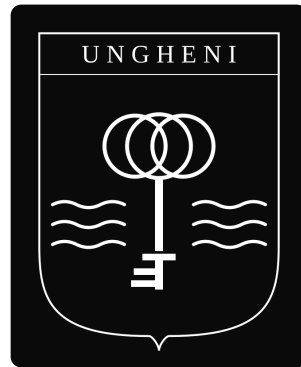
Varianta mono deschis pe fundal negru.