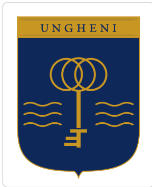
Mark primar color pe fundal alb — curat, contrast maxim.