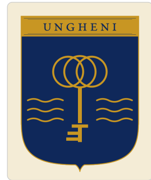
Mark primar pe fundal crem deschis — contrast scăzut acceptabil.