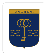
NU — mark primar sub 60 mm — folosește varianta secundară.