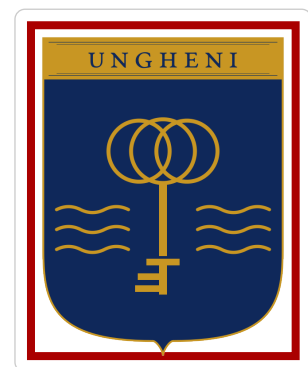
NU — chenare suplimentare în jurul mark-ului.