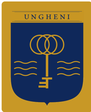
NU — mark color pe fundal aur — banderola se topește în fundal.